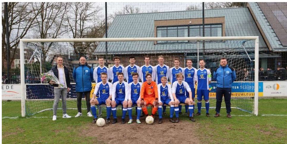
Foto 1 Hoonhorst 1 zondag